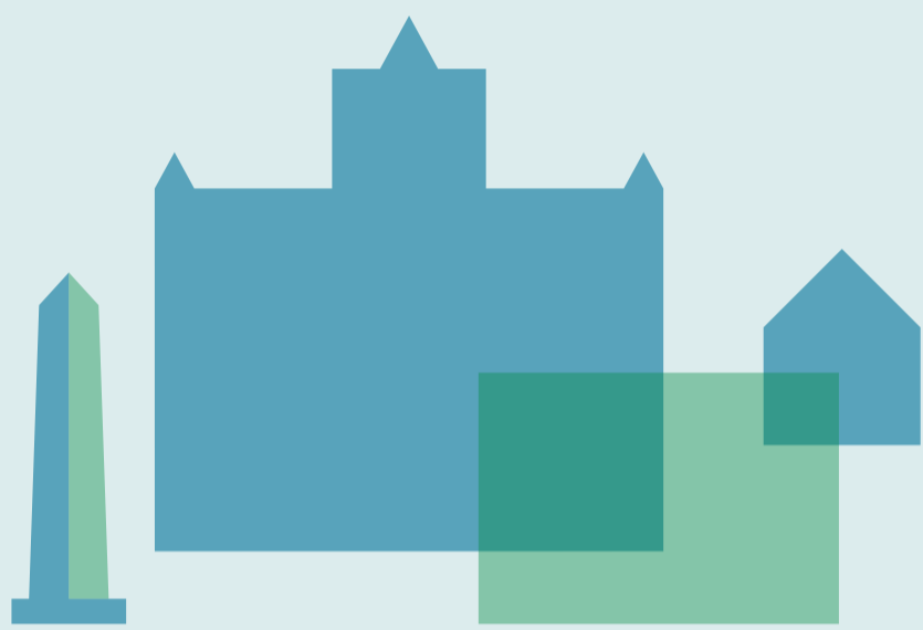
BAUSTRUKTUR, STADT- BILD UND DENKMALE