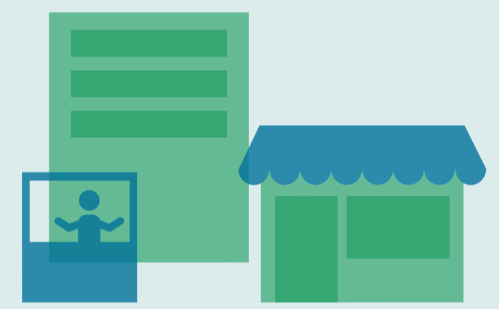
LOKALE ÖKONOMIE UND EINZELHANDEL