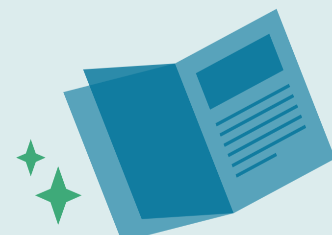
KULTUR UND BILDUNG

Für starke Quartiere, ein attraktives Lebensumfeld und ein gutes Leben in der Nachbarschaft – die Städtebauförderung ist eines der wichtigsten Instrumente der Stadtentwicklung. Über 12.500 Gebiete wurden bisher gemeinschaftlich von Bund, Ländern und mehr als 4.000 Kommunen gefördert. Die städtebaulichen Bedarfe unterscheiden sich einerseits zwischen den Städten und Regionen, andererseits aber auch innerhalb einer Stadt oder eines Ortes. Die Programme der Städtebauförderung greifen daher die unterschiedlichen Herausforderungen auf, die sich aus einer sozial, wirtschaftlich, demografisch und ökologisch nachhaltigen Stadtentwicklung ergeben.