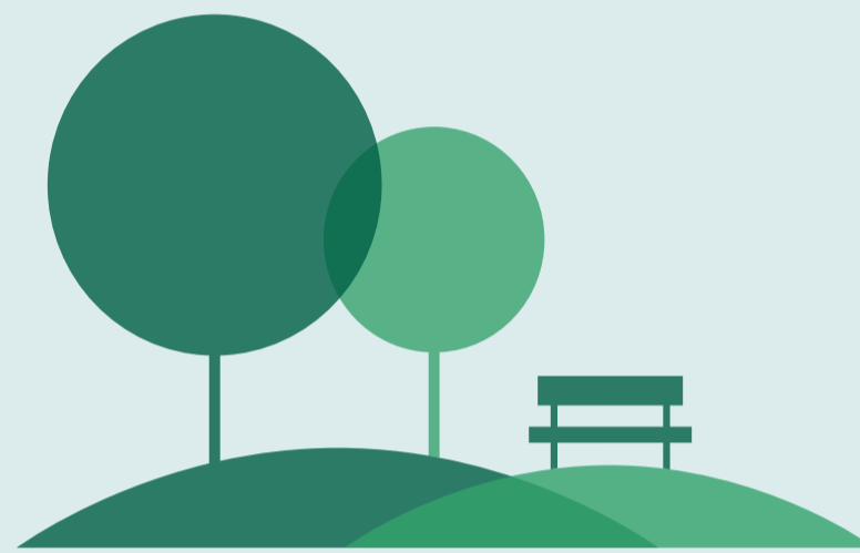
FREIFLÄCHEN UND GRÜNSTRUKTUR