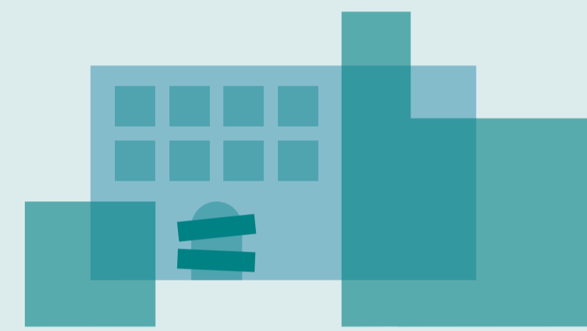
NUTZUNGSSTRUKTUR UND LEERSTAND