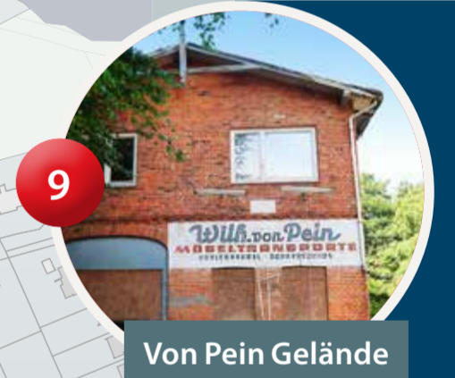
Von Pein Gelände