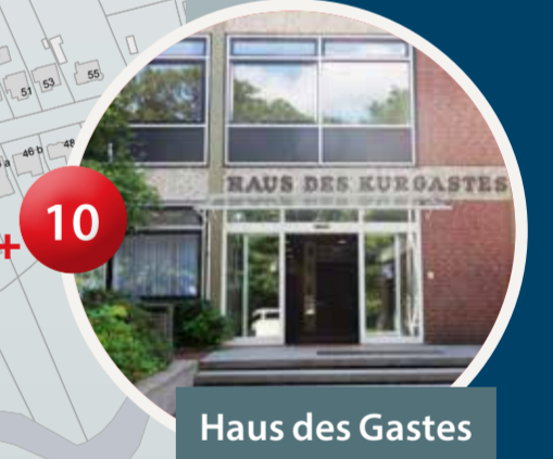
Haus des Gastes