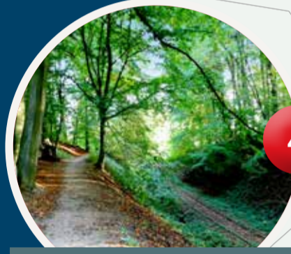
Waldweg an den Schrebergärten