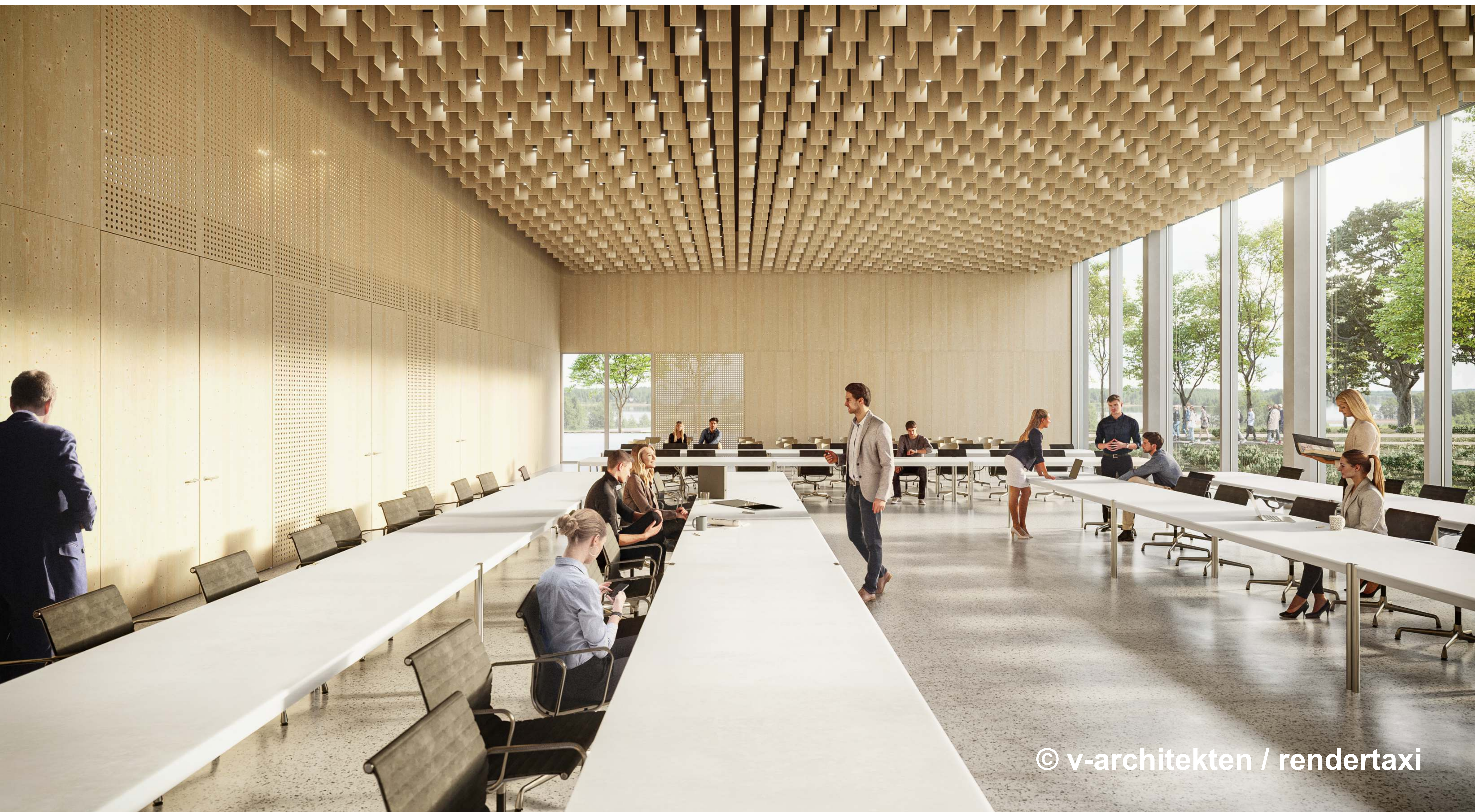
DER NEUE RATSSAAL