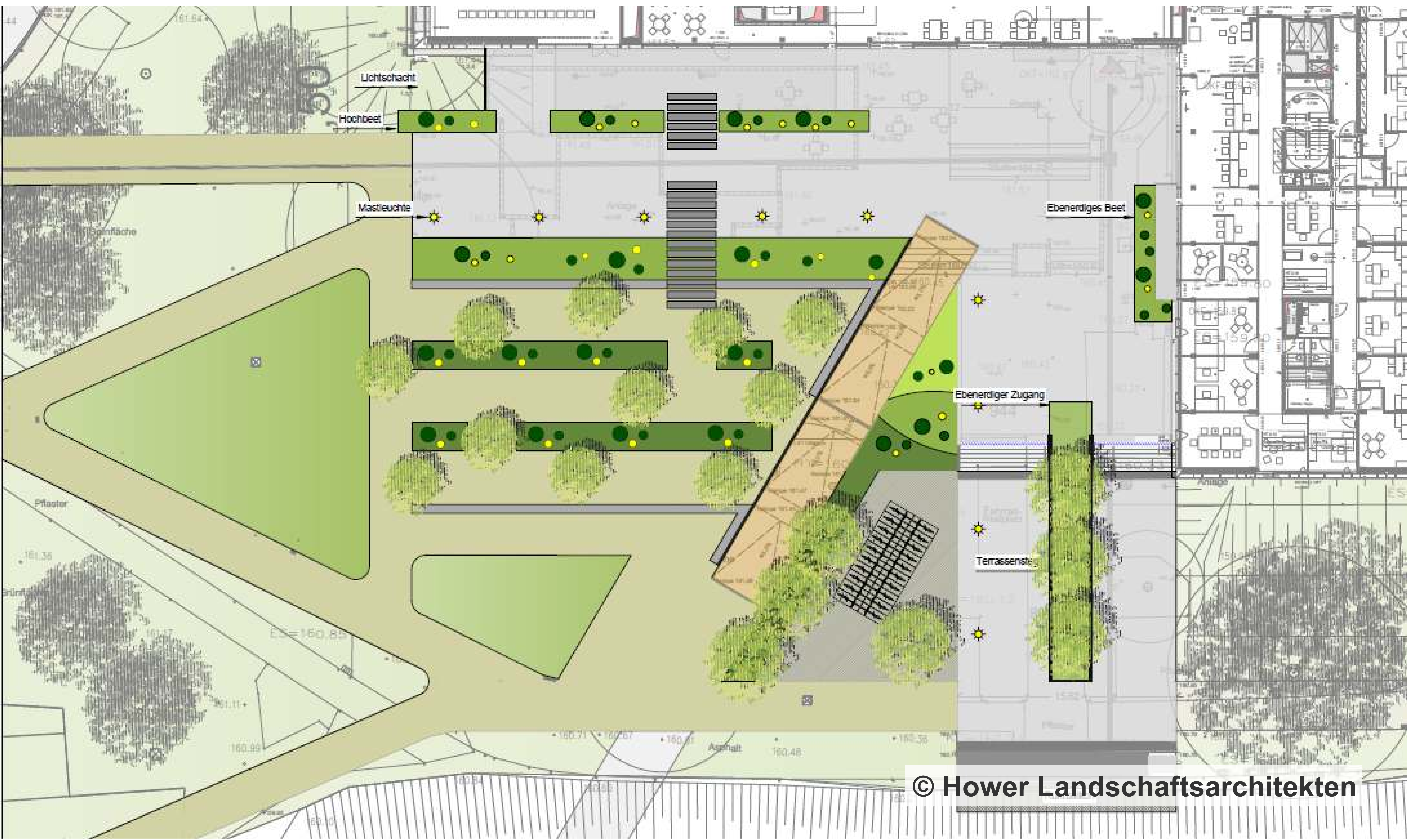
DER NEUE AUSSENBEREICH