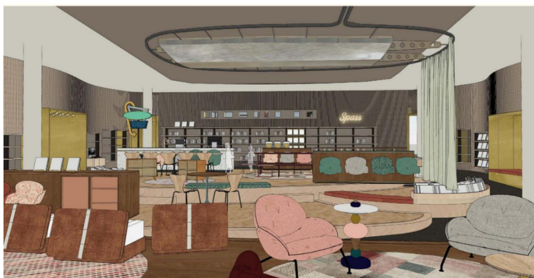
Planung der Kinderbibliothek (copyright: includi by Aat Vos)