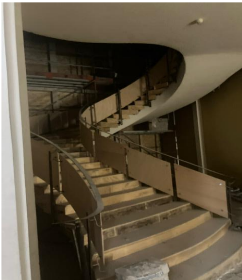
Umbau der Kinderbibliothek

Der offizielle Beginn der baulichen Sanierung war der 20.03.2023 – der Umbau ist noch nicht abgeschlossen.